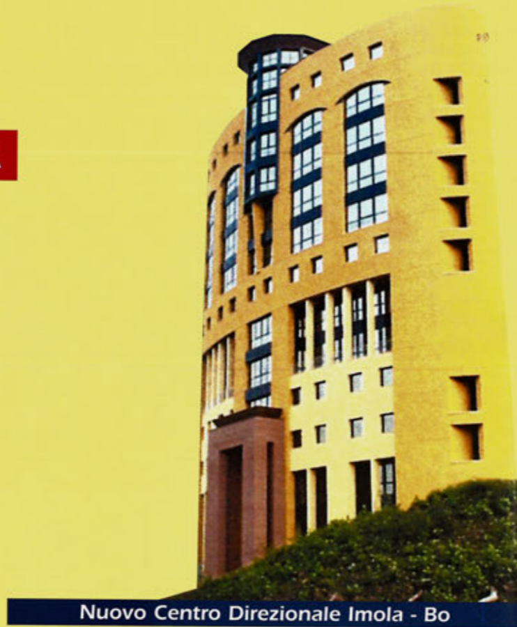
Nuovo Centro Direzionale Imola - Bo

Il gruppo Mercatone Uno si colloca in una posizione di primaria importanza nella distribuzione di prodotti non alimentari in Italia.