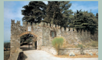
Castello di Bornato