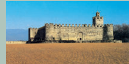
Castello di Passirano